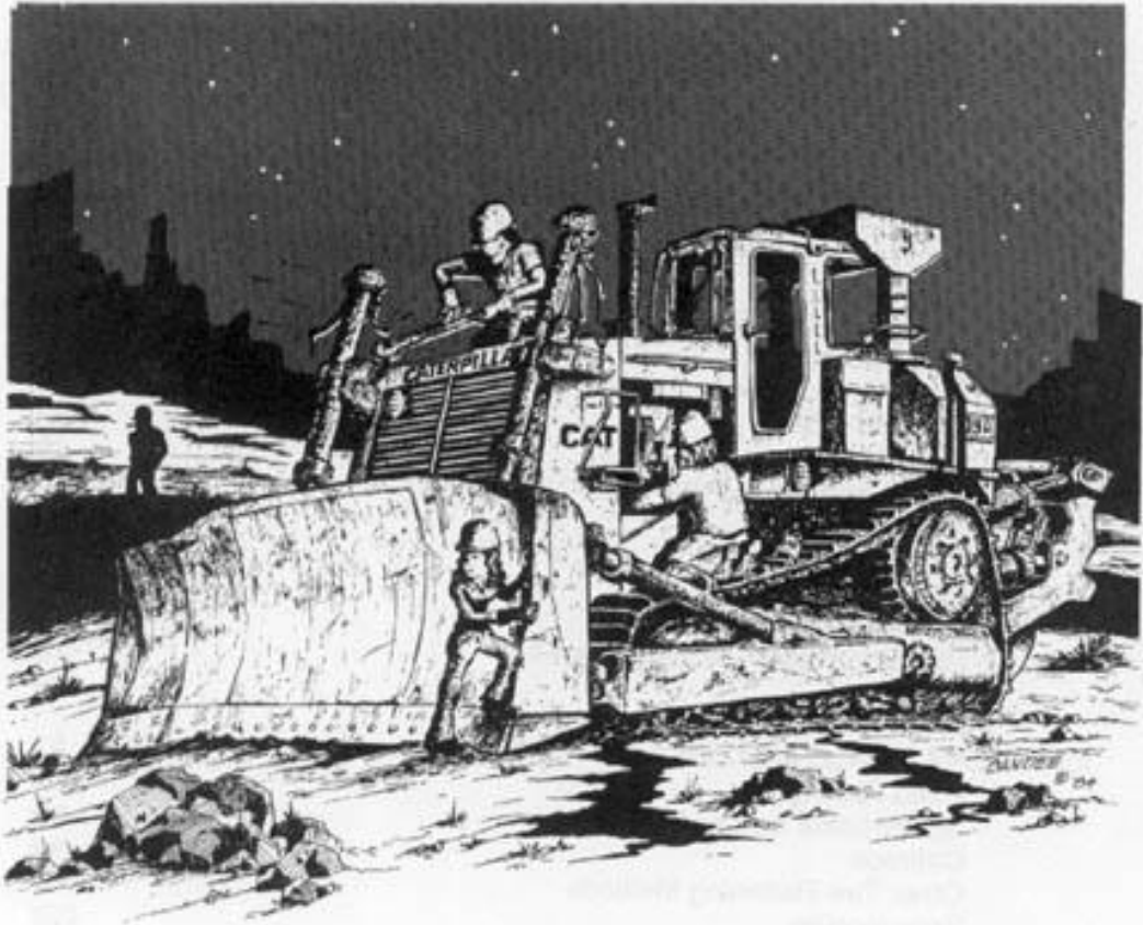
RAID AT COMB WASH by Roger Candee

Wilderness needs no defense, only more defenders.