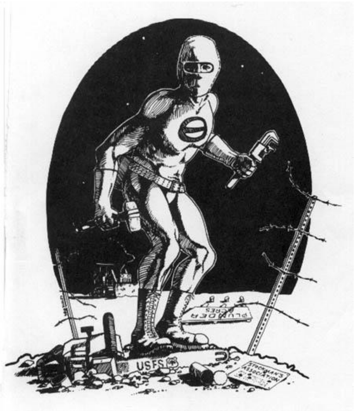
劫掠土地 美国林务局 牧场主联合会